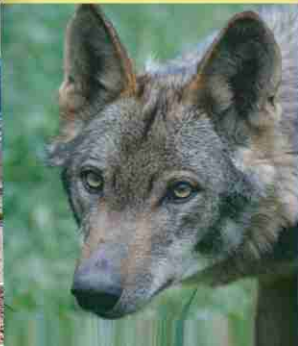
LA CASA DE LA NATURALEZA